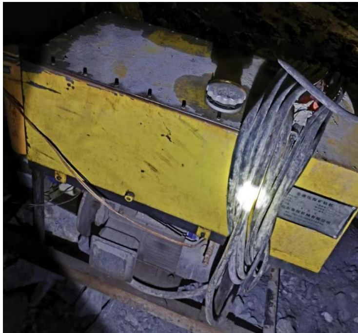
图 2.4-2 探放水钻机图

企业配备了一台型号为 KY-150 型探水钻机，两台型号为 YT-28 型探水钻机，并进行了探放水作业，探放水记录见文本附件。