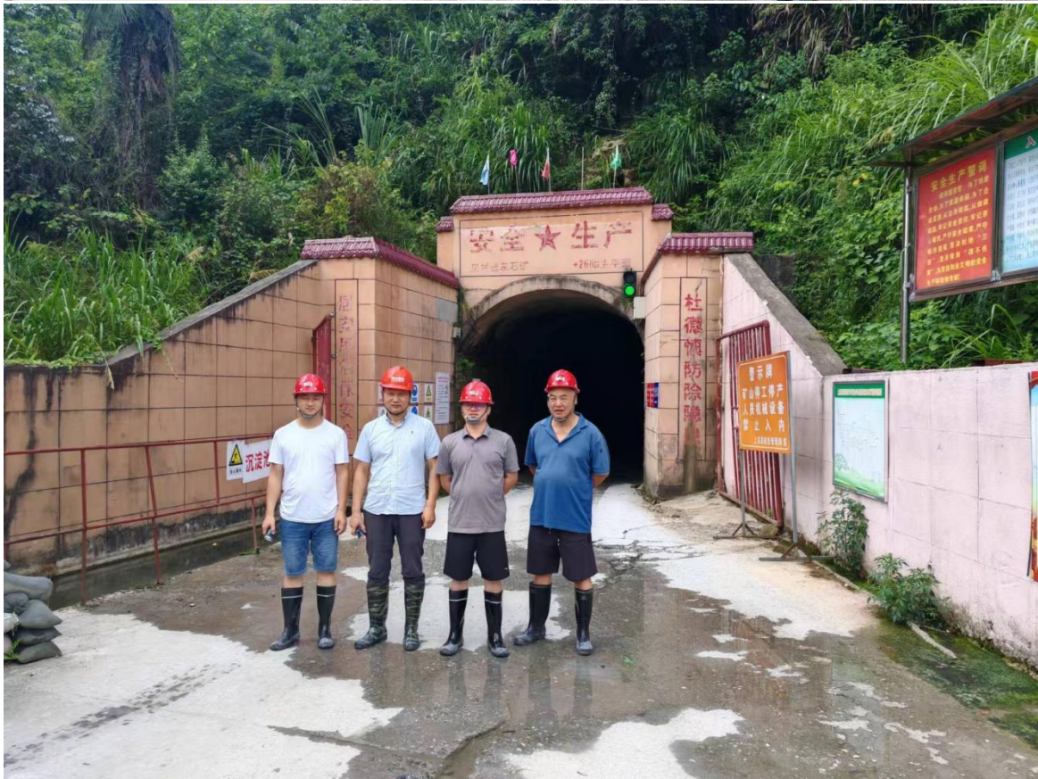
评价人员现场合影