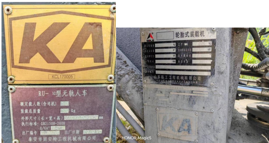
图 2.4-1 运人汽车及装载机型号